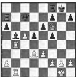
Hort – Portisch, Madrid 1973

Wie brachte Grossmeister Hort seinen Angriff voran?