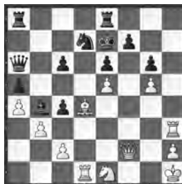
Wladimirow – Haritonow, Alma Ata 1979

Die Position des schwarzen Königs ist sehr verdächtig. Wie kann Weiss gewinnen?