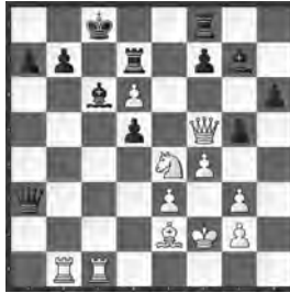
Hartston – Durran, Alicante 1975

Viele weisse Figuren zielen auf die schwarze Königsstellung. Wie setzte Weiss zum Schlag an?