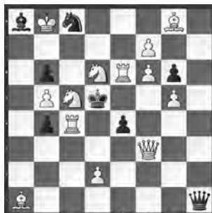
5 André Chéron Journal de Genève 1974