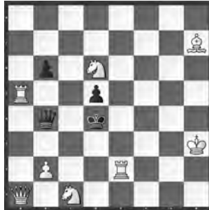
1 Abdelaziz Onkoud Liberté-Dimanche 1995 2. ehrende Erwähnung

6) beweist, dass auch ein Schachschlüssel äusserst «problematisch» sein kann: 1. Sd4+ ! Kc7/Kxd7/Ke7/Ke6/Kd5/Kc5 2. b8D(T)/f8S/fxe8D(T)/f8D(L)/De5/Th5. Erstaunlich ist weniger, dass das Schachgebot zum Ziel führt, sondern dass nur dieser Zug Erfolg hat, obwohl dem sK 5 weitere Fluchtfelder (also insgesamt 7) zugestanden und alle verschieden beantwortet werden. Und dies, obwohl die schwarzen Figuren alle am Rand stehen!