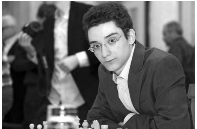
Gewinn als Einziger zwei Partien: der italienisch-amerikanische Doppelbürger GM Fabio Caruana.

25. ... exf4 26. ♗xf4 ♜xg5+. Einzig 26. ... ♗e5! hielt den Laden dicht, wie die folgenden Analysen zeigen: 27. ♙h1 (27. ♗xg6 fxg6 28. ♖e2 ♗f3+ 29. ♙g2 ♗xe1+ 30. ♜xe1 ist ausgeglichen) 27. ... ♖f5 28. ♗xg6 (28. ♜f1? ♗xd3; 28. ♗d5 ♙d8!) 28. ... fxg6 29. ♖e2 ♗xg5 30. ♗xg5+ (30. ♜f1 ♙f4, und dank der gut postierten Figu-