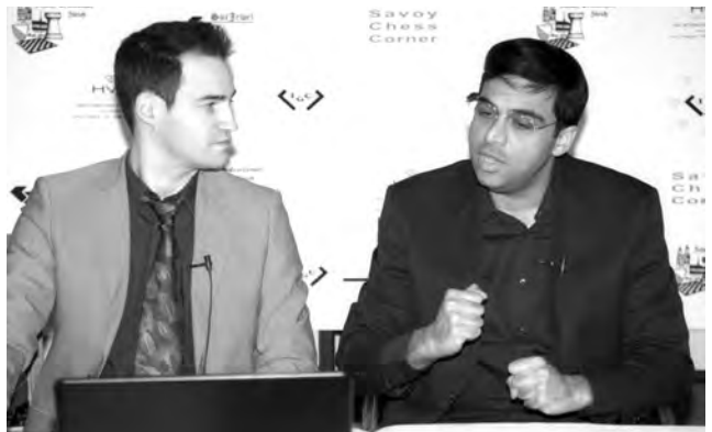
Weltmeister Viswanathan Anand mit dem im Hotel «Savoy» als Kommentator wirkenden Schweizer GM Yannick Pelletier.