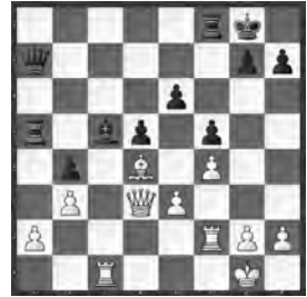
Kotow – Tscholmow, Moskau 1971

Viele weisse Figuren zielen auf die schwarze Königsstellung. Wie setzte Weiss zum Schlag an?