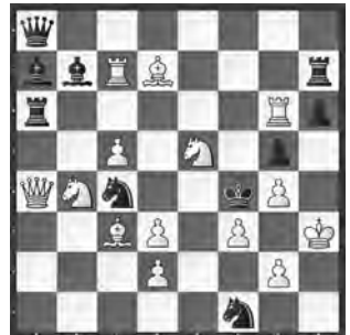
4 Johan C. van Gool Journal de Genève 1978