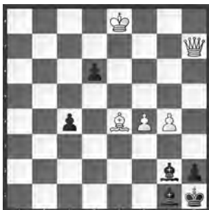
# 7 5+6