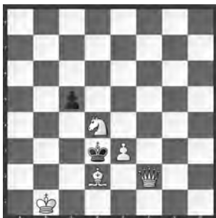
# 3 5+2