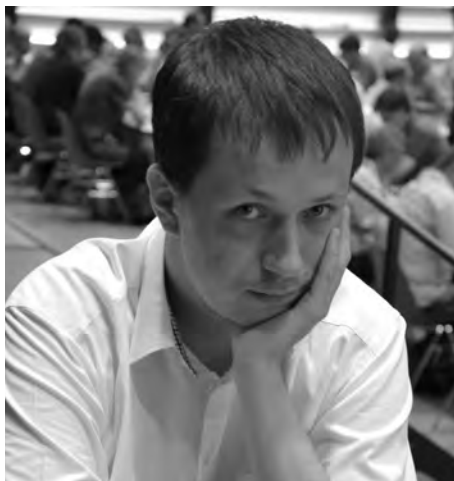
Radoslaw Wojtaszek: craquage dans la dernière ronde.

Pour cet article, j'ai décidé de présenter quelques extraits des moments les plus marquants du tournoi: une montée de roi spectaculaire de David Navara, deux occasions manquées par Pavel Eljanov, le craquage de Radoslaw Wojtaszek à la dernière ronde, et la victoire décisive de Maxime Vachier-Lagrave!