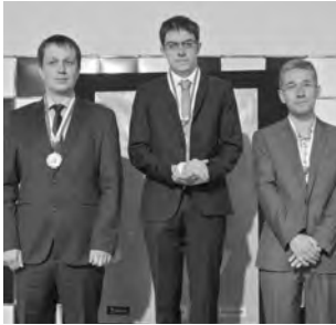
Das Siegertrio des Grossmeisterturniers (von links): GM Radoslaw Wojtaszek (2.), GM Maxime Vachier-Lagrave (1.), GM Michael Adams (3.).