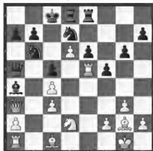
Bucher – Gallagher SEM 2015, Nationalturnier

Schmieden Sie das weisse Eisen, solange es heiss ist. Wie geht das?