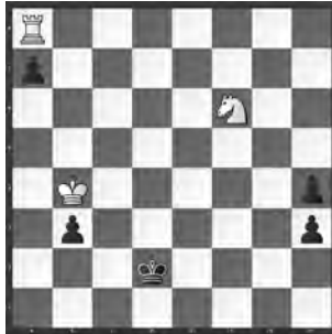
Weiss zieht und gewinnt

Weiss beginnt mit einem vorausschauenden Königsschritt, dessen tieferer Sinn erst im 6. Zug ersichtlich wird.