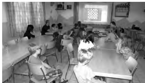
Die täglichen Theorieeinheiten im SEM-Jugendlager kamen bei Spielern gut an.