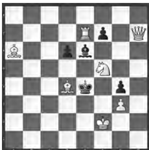
# 2 v 7+5