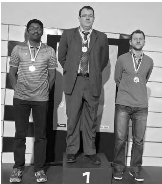
Le podium du tournoi de maîtres (de gauche): GM Baskaran Adhiban (2 ème ), GM Emil Sutovsky (1 er ), GM Tigran Gharamian (3 ème ).

66. ♜be1? Le très joli 66. ♖e8+! aurait été décisif: 66. ... ♖g8 (66. ... ♜xe8 67. ♜xb7+ puis ♜ff7 et gain; 66. ... ♖h7 67. ♜f8! ♜xe5+ 68. ♖f6 ♖c6 69. ♜b6! et gain) 67. ♖h6 ♜xe8 68. ♜xb7 ♖f5+ 69. gxf5 exf5 70. ♜g1 ♜exe5 71. ♜xg6+ ♖f8 72. ♜gg7 puis h5, ♖h7, et un mat à suivre. 66. ... ♖c6 67. h5 gxf5 68. gxf5 ♖xe5 69. h6+ ♖h7 70. ♖f6. 70. ♖xe5 ♜xe5+ 71. ♖f6 ♜xa5 72. ♖xe7 ♖xh6 revient à tour et cavalier contre tour comme dans la partie. 70. ... ♖c6 71. ♜c1 ♜xa5 72. ♜g1 ♜h5?! 72. ... ♜c7 était plus simple. 73. ♜xc6 ♖d7! 73. ... bxc6?? 74. ♖xe7 ♜xh6 75. ♖f7 puis ♖e8-♖f6 gagne!