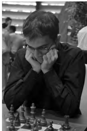
Maxime Vachier-Lagrave: quatrième victoire à Bienne.

16. exd5 ♙xh3. 16. ... a6 17. ♗c7! ♜xc7 18. d6 est peut-être