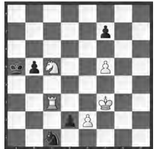
Weiss zieht und gewinnt