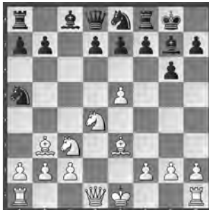
Fischer – Reshewski New York, 1958

Eröffnungstaktik! Wie erhält Weiss klaren Vorteil?