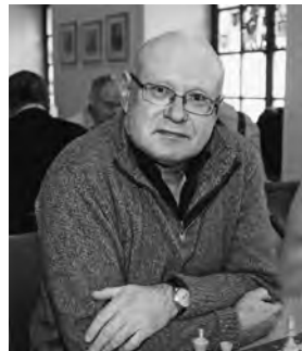
Helmut Eidinger (1950–2015).