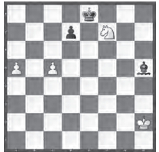
Weiss zieht und gewinnt