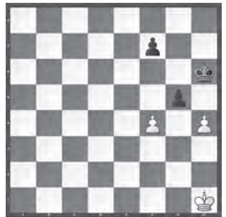
Weiss zieht und hält remis