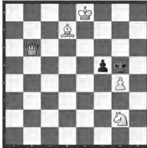
15039 Wladimir Koschakin Magadan (Rus)