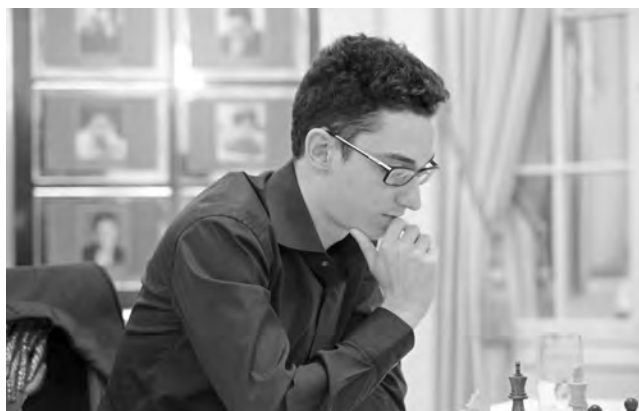
Victoire limpide contre le champion du monde: Fabiano Caruana.

Dans cette position, Veselin Topalov n'avait pas vu de mat pour les Blancs et croyait donc tenir la nulle. Magnus Carlsen, content d'avoir atteint le soixantième coup, souvent synonyme d'un rajout de temps dans les forts tournois, se met à réfléchir pour tenter d'en découvrir un. Sauf qu'il