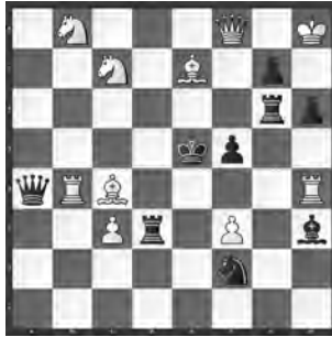
15037 Sven Trommler Dresden (D)