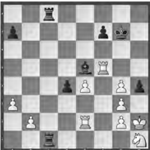
Bisguier – Fischer New York, 1965

Wie nutzte Fischer mit Schwarz die Kraft seiner Figuren?