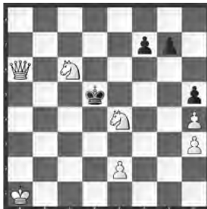
15041 Petrašin Petrašinović Belgrad (SRB)