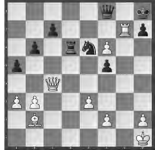
Fischer – Andersson Siegen, 1970

Eine Variante der Partie ergab diese Stellung. Wie gewinnt Weiss?