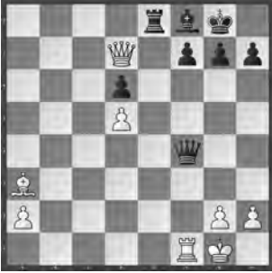
Reshewski – Fischer Palma de Mallorca, 1970

Schwarz am Zug. Finden Sie die gewinnbringende Idee.