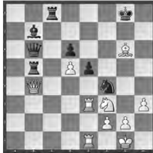
Magnus Carlsen (Nor) – Anish Giri (Hol)

Après avoir été rapidement en danger dans cette troisième ronde, Anish Giri a défendu une position difficile d'excellente manière. Le norvégien va maintenant rater un gain d'une extrême difficulté juste avant le contrôle de temps.