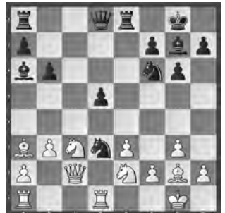
Byrne – Fischer New York, 1963

Tiefblick ist gefragt. Schwarz am Zug gewinnt.