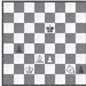
Weiss zieht und gewinnt