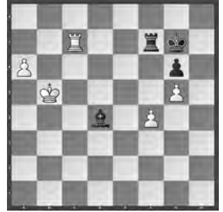
Jon Ludvig Hammer (Nor) – Veselin Topalov (Bul)

Après avoir d'abord été beaucoup mieux, Jon Ludvig Hammer devait défendre une finale extrêmement difficile contre le futur vainqueur du tournoi. Mission accomplie avec succès puisqu'il obtient la position ci-dessus, dans laquelle il force la nulle par un simple échange de tours.