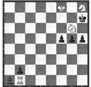
15066 Baldur Kozdon Münster (DE)