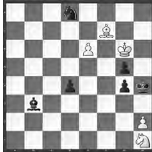
Weiss zieht und hält remis

1. ehrende Erwähnung, «Chess Life and Review», 1991