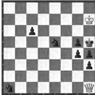
15065 Eligiusz Zimmer Piotrkow Tryb (PL)