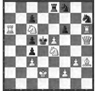
15062 Valerij Schanschin Tula (RU)