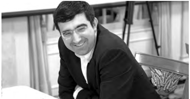
Der spektakulärste SMM-Transfer: Ex-Weltmeister Wladimir Kramnik spielt neu für den Nationalliga-B-Klub Herrliberg.