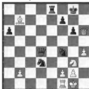
Admiraal – Bok Wijk aan Zee 2016

Weiss am Zug. Eine Angriffsposition à la carte!