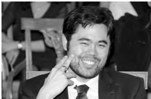
Wieder ein knapper Sieg in Zürich: Hikaru Nakamura.

Das im Hotel «Savoy Baur en Ville» am Paradeplatz von zahlreichen Zuschauern verfolgte Blitzturnier bildete einen denkwürdigen Schlusspunkt unter den zum fünften Mal ausgetragenen Zürcher Weltklasse-Event mit fünf Spielern aus den Top-10 der Weltrangliste. Dessen neue, für Langpartien wesentlich kürzere Bedenkzeit als üblich brachte einigen Spektakel. Für den ersten Highlight sorgte Viswanathan Anand gleich in der Startrunde, als er den früheren Weltrang-