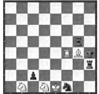
Weiss zieht und hält remis