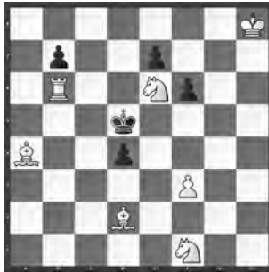
15063 Petrašin Petrašinović Belgrad (SB)