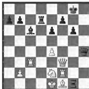
Van Wely – Carlsen Wijk aan Zee 2016

Kombiniere wie der Weltmeister. Schwarz am Zug gewinnt!