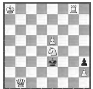
3. ehr. Erw. 15221 (2/2020) Petrašin Petrašinović