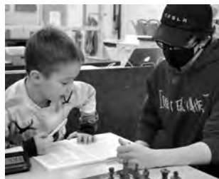
Die Stappenmethode ist ein wichtiger Bestandteil des Juniorentrainings im Schachklub Aarau.