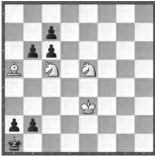
Weiss zieht und gewinnt

1. ♖c4! Der Umwandlung der schwarzen Freibauern muss Einhalt geboten werden. Wenn Weiss versucht, seine angegriffenen Figuren zu retten, verliert er sogar noch: 1. ♖b3+? ♗b1 2. ♙c3 ♙c2 3. ♙xb2 ♙xb2 4. ♖d4 a1 ♖0:1. 1. ... bxс5 . Andere Züge führen zum Matt oder einem gewonnenen Endspiel mit drei Leichtfiguren gegen die drei schwarzen Bauern. 1. ... bxa5 2. ♖b3+ ♗b1 3. ♖a3#; 1. ... ♗b1 2. ♖a3+ ♗c1 3. ♖d3+ ♗d1 4. ♙d2 b1 ♗5. ♖f2#; 1. ... b1 ♗2. ♙c3+ ♗b2 3. ♙xb2+ ♗b1 4. ♖e4 ♙c2 5. ♙a1 ♗b3 6. ♖d3 ♗b4 7. ♖c3 b5 8. ♖xa2+ 1:0. 2. ♖d2! 2. ♖d2? b1 ♗3. ♙c3+ ♗b2+ 4. ♙xb2+ ♗b1 ½:½. Ein Angriff auf das Feld b1 aus einer anderen Richtung mit 2. ♖a3? ermöglicht Schwarz, sich mit einer Unterverwandlung in einen Turm zu retten, um die weisse Attacke durch