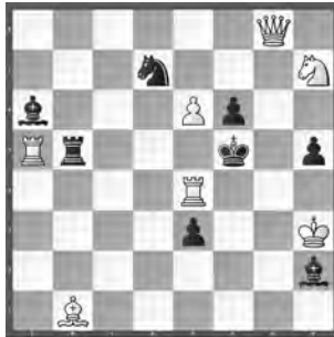
15289 Herbert Ahues Publikation post mortem