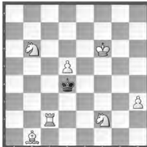
15293 Petrašin Petrašinović Belgrad (Srb)