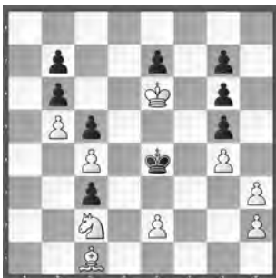
1. ehr. Erw.: 15203 (5/2019) Wilfried Neef

3. ehrende Erwähnung Petrašin Petrašinović 15221: 1. ♖c3? (2. ♖e4+ ♖d2 3. ♖a2 [4. ♜d8]) ♖d2 2. ♖d5 ♖e2 3. ♜f8 ♖d2 4. ♜f2; 1. ♖d6/♖f6/♜f8/♜g4/♜g6? ♖d4! 1. ♖c5? (2. ♖d3+ ♖d2 3. ♖e4+ ♖e1 4. ♜g1; 1. ... ♖d2! 1. ♖b4? ♖f4! 1. ♖b2? ♖xe4! – 1. ♖f2! ♖d2 2. ♜g3 ♖e2 3. ♜g1 ♖d2 4. ♜d1 1. ... ♖d4 2. ♖d3+ ♖xe5 3. ♜g6 (4. ♜e4) 2. ... ♖c5 3. ♜b8 ♖c6 4. ♜d6 1. ... ♖e2 2. ♜f8 ♖d2 3. ♜f3 (4. ♜d1) 1. ... ♖xf2 2. ♖e4 ♖f1 3. ♜c2 ♖e1 4. ♜g1.