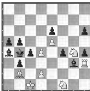
2. ehr. Erw.: 15258 (2/2021) Hannes Baumann