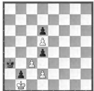
Weiss zieht und gewinnt

Lösungen mit Kommentaren bis 15. Juli per E-Mail an roland.ott@swisschess.ch