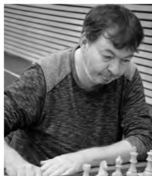
Der amtierende Schweizer Meister GM Joe Gallagher gibt bei Nationalliga-A-Aufsteiger Nimzowitsch Zürich sein SMM-Comeback.

SG Zürich: 25 Allschwil: 8 Biel: 7 Nimzowitsch Zürich: 6 Genf: 5 Bern (Zytglogge): 3 Birseck: 3 Réti Zürich: 3 Winterthur: 3 Luzern: 3 Basel: 2 Reichenstein: 1 Mendrisio: 1