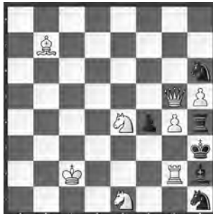
3 Viktor Tschepischnij Schachmaty 1973, 2. Preis