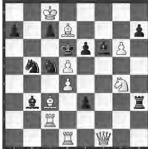
1 Evgenij Umnov Turnier Schachklub Moskau 1938, 1. Preis