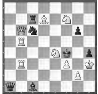
15224 Herbert Ahues Publikation post mortem (V.)