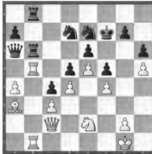
Vachier-Lagrave – Nepomniaschtschi (Fortsetzung)

Schwarz scheint sich einigermaßen stabilisiert zu haben. Oder doch nicht?