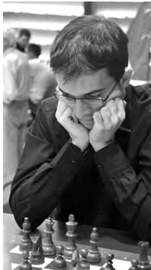
Superbe démonstration de Maxime Vachier-Lagrave (photo) contre Ian Nepomniachtchi.

19. ♖b1!? b6 20. ♘d2 ♗f8 21. ♜f3 ♖g5, 21. ... ♙g6 était possible, mais le fou de cases