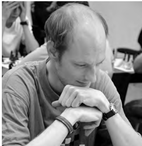
Oliver Marti wirft in diesem spannenden «SSZ»-Feature einen Blick in die (Online-)Vergangenheit des Schachsports.