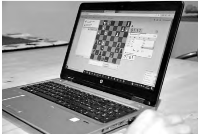
Auch wenn wir alle das analoge Klötzchenschieben vermissen, so bietet uns das Internet doch viel mehr Möglichkeiten zur Ausübung des Schachspiels, als dies andere Sportarten von sich behaupten können.

Ein halbes Jahr später war es schon die damalige Schach-Elite, die dem Telegraf die nächste Ehre erwies – diesmal in London. Zwei Teampartien zwischen Howard Staunton und Captain Hugh A. Kenneds gegen ein Fünfer-Team um dessen prominentesten Vertreter Captain William Evans wurden gespielt. Die erste Partie