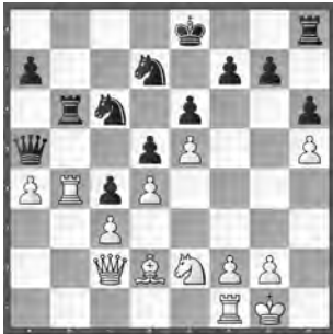
Vachier-Lagrave – Nepomniaschtschi

Was hatte Schwarz bei seinem letzten Zug Se7–c6 bestimmt unterschätzt?