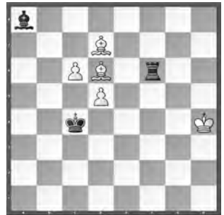
Weiss zieht und gewinnt