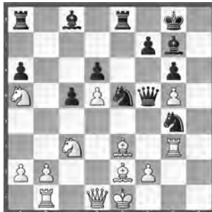
Degtjarew – Gähwiler SMM, Réti – Winterthur

Wie münzte Schwarz seine Überlegenheit in einen vollen Punkt um?