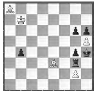
Weiss zieht und gewinnt

Lösungen mit Kommentaren bis 10. Dezember per E-Mail an roland.ot@swisschess.ch