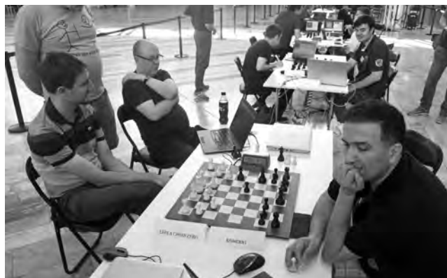
Duell der Engine-Giganten an der Computer-Weltmeisterschaft: Leela Chess Zero gegen Komodo.