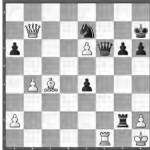
Kappeler – Cacciola SMM, Mendrisio – Réti

Wie kann Schwarz die Hoffnung auf Rettung aufrechterhalten?