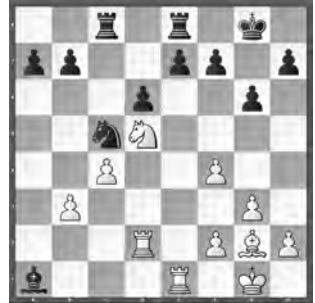
Buss – J. Novkovic SMM, Echallens – St. Gallen

Schwarz hat eine inkorrekte Kombination ausgeführt. Wie kann Weiss dies ausnutzen?