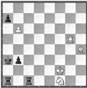
Weiss zieht und gewinnt

Preis, «Suomen Tehtävienekät», 2014–2016