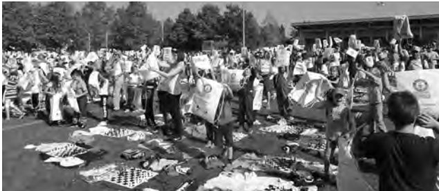
Mit 1459 Teilnehmern wurde der bisherige Schachlektion-Weltrekord in Muttenz klar übertroffen.