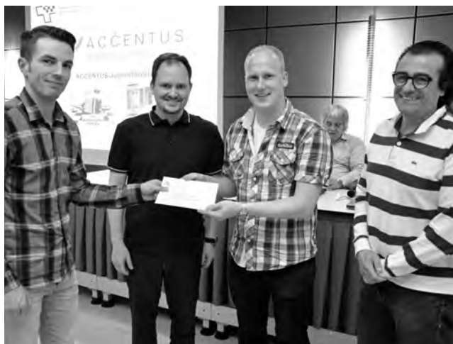
An der SSB-Delegiertenversammlung im Juni bekamen Die Schulschachprofis den Accentus-Jugendschach-Förderpreis.