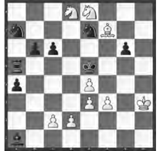
2 Virgil Nestorescu Bulletin Ouvrier des Echecs 1952, WCSC 2016, 2. Runde