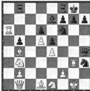
Yogit – Rydstrom U20-WM in Orissa

Weiss muss exakt verteidigen! Wie hält er das Gleichgewicht?