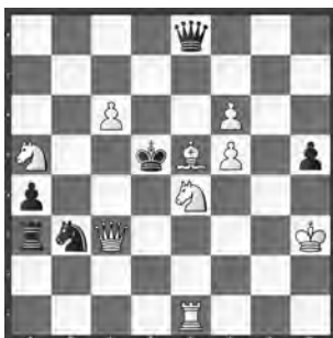
15085 Rainer Paslack und Gerhard Maleika Bielefeld und Gütersloh (D)

15078 B. Kozdon. 1. ♚d7! (2. c8 ♖ ♖) ♚f6+! (1. ... ♖a4+? 2. ♖b5+ ♖a7 3. ♖b7; 1. ... ♚f8+ 2. ♖xf8+; 1. ... ♖xb7 2. ♖a3+ ♖a7 3. ♚c6 ♖xa3 4. c8 ♖+) 2. ♖xf6 ♖a4+ 3. ♖b5! ♖xb5+ 4. ♖c6+! ♖b7! 5. ♖a4+ ♖a7 6. ♖b5! (7. ♚d6,d8,c8,c6) ♖b7 7. ♖a5+ ♖a7 8. ♚c6! ♖xa5 9. c8 ♖+ ♖a7 10. ♖b7. – «An Endspiel-Mattstudien erinnernder 10-Züger mit Opfer der beiden weissen Schwerfiguren» (RO).