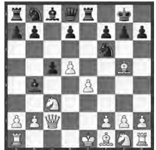
Weerasinghe – Holleland U20-WM in Orissa

Wie kann Schwarz die schwache weisse Eröffnungsbehandlung ausnutzen?