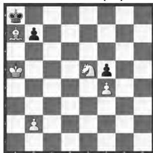
15090 Anatolij Karamanits und Wladimir Samilo Dnjepropetrowsk und Charkov (UA)