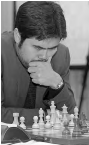
Hikaru Nakamura (photo) a perdu contre son compatriote américain Wesley So.

25. ... ♖b4?? 26. ♚c3 ♜xd4 27. ♜xb4 ♜e2+ 28. ♜h1. Peter Svidler s'est alors rendu compte, ici ou un ou deux coups auparavant, qu'il perdait une pièce: 28. ♜h1 ♜xc1 29. ♜b8+ ♜h7 (29. ... ♜f7 30. ♜xc7+ et gain) 30. ♜b1+ et gain. 1-0.