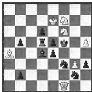
15086 Herbert Ahues (†) Publikation post mortem (V.)