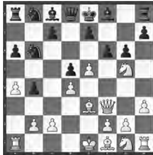
Srijit – Martins U20-WM in Orissa

Schwarz steht verdächtig. Was ist hier der stärkste Zug für Weiss?