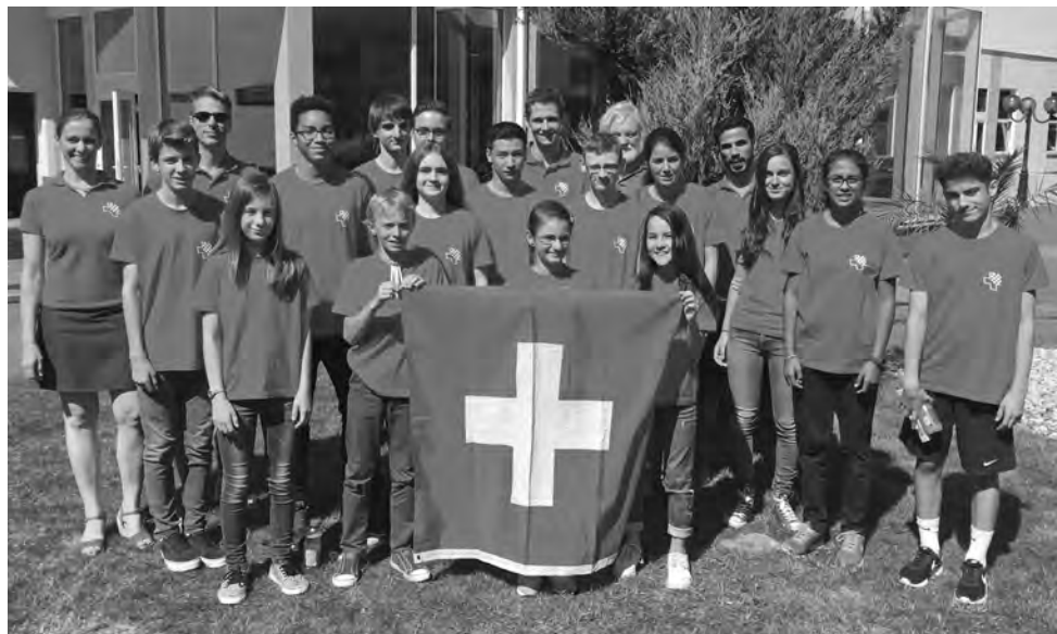
Die Schweizer Delegation an der Jugend-EM in Prag.

Ein Ruhetag bedeutet immer eine Zäsur im gewohnten Ablauf. Hat man erst einmal Tritt gefasst im Turnier, stellt sich eine gewisse Routine ein. Frühstück um acht, Vorbereitung um halb zehn, danach ein bisschen Sport, Mit-